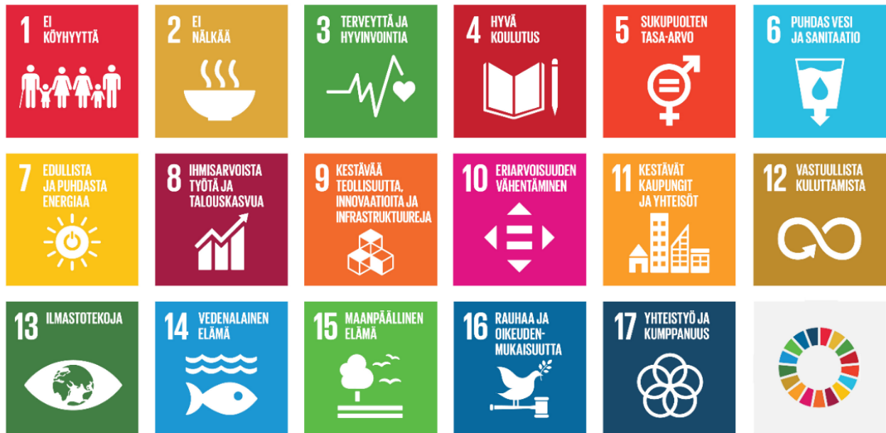
Kuva 1: ykliitto.fi

Kestävyytyön edistämiseksi ammattikorkeakoulut ovat yhteistyössä laatineet kestävyyslupaukset sekä niihin liittyvät toimenpiteet. Ammattikorkeakoulujen kestävyysohjelma 2026–2030 antaa yhteisen viitekehyksen ja tukee kaikkien Suomen 24 ammattikorkeakouluyhteisön työtä kohti kestävämpää ja vastuullisempaa tulevaisuutta.